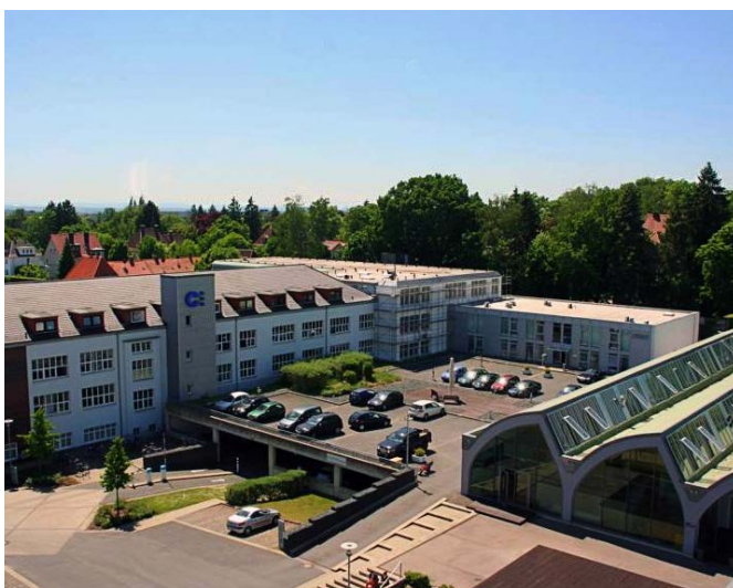
Campus 3, Braunschweig, Deutschland