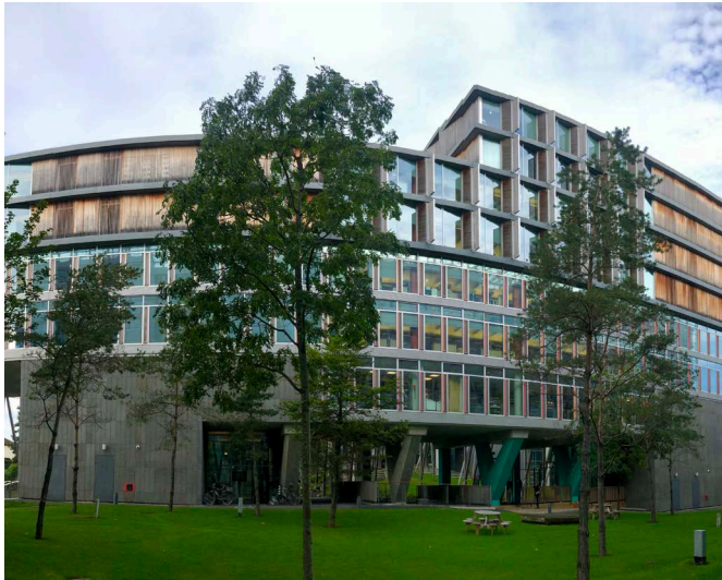
Elm Park, Dublin, Irland