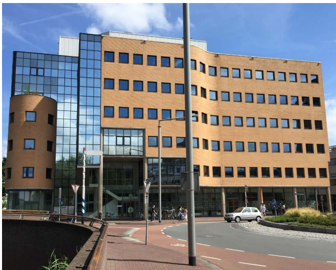
DOK 40, Dordrecht, Holland