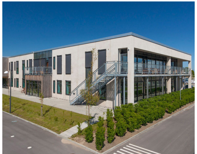
Kajakvej 2, Kastrup, Dänemark