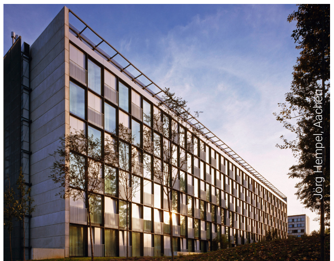
INNSIDE Hotel, Düsseldorf, Deutschland